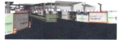
Foto area pemagaran depan Gerbang Selatan

Jalur masuk kendaraan Roda 4 Khusus Tamu