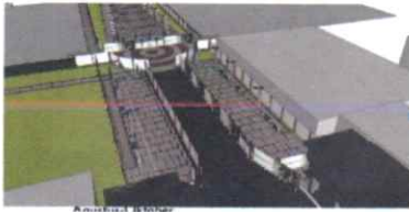
Foto area pemagaran sekitar area ATM Center

Jl. Ganesa No. 10, Gd. CRCS Lt.5 Bandung 40132 Telp : (022) 86010100/86010011 Fax: (022) 86010041 Situs Web : http://ditsp.itb.ac.id e-mail : ditsp@itb.ac.id